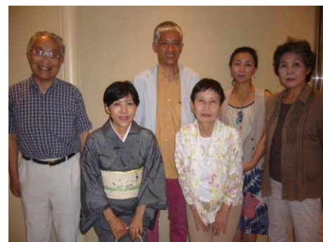
私達が3回シリーズで実体験を語ります。 BY チーム「キラキラ・ハッピー」

再発、余命宣告されても、ガンから元気になった6人… その6人がチームを作り講演会をします。 6人、一人一人が自分なりの治し方で見事、復活!!!